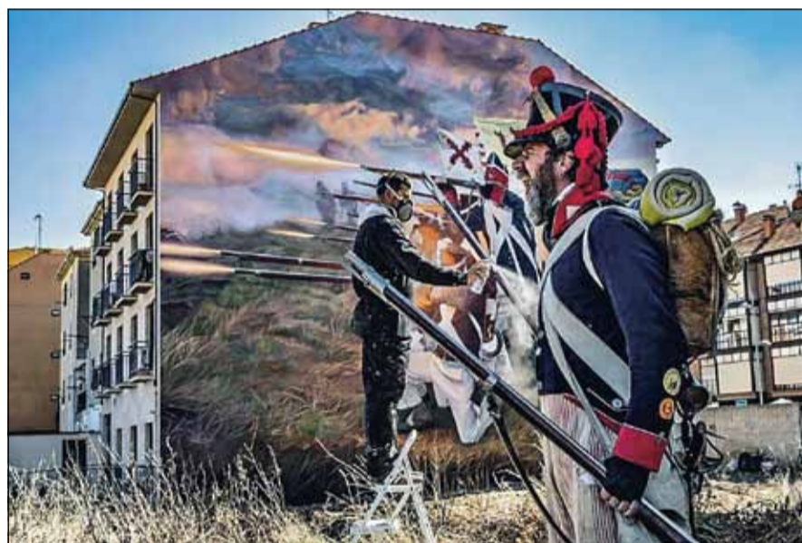
Foto del ganador del año pasado, que expondrá también en Pallarés.